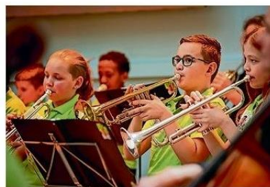
■ Close up van de blazers