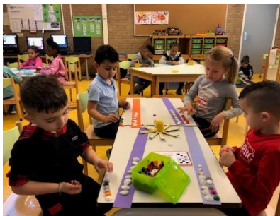
Groep 1 legt schelpen, dopjes, blokjes, etc neer op de strook. Het moeten er steeds 8 zijn: evenveel als de armen van de Octopus.

Ook komt in dit thema het getal 8 aan bod. De kinderen leren dat Octo acht betekent. De Octopus heeft immers 8 armen, tel ze maar na.