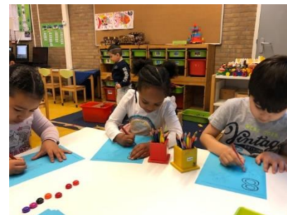
Groep 2B zorgt dat alle octopussen op het werkblad 8 armen krijgen. Dus goed tellen hoeveel erbij getekend moeten worden.