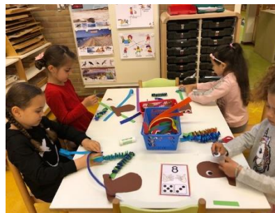
Groep 2A knutselt een octopus. Ze vouwen maar liefst 8 muizentrappen. Een hele klus, maar wel een leuke!