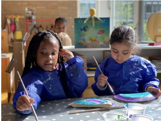
We knutselden een kwal en leerden het Engelse woord Jellyfish.

We ontdekken en leren veel in dit thema. Zo leren de kwallen dat pesten geen oplossing is, we helpen de heremietkreeft met het bouwen van een nieuw huis voor Octopus en nog veel meer.